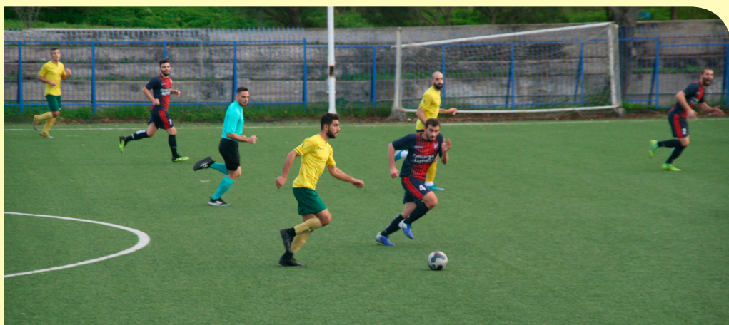
≠ Στιγμιότυπο από τη νίκη του Κένταυρου.