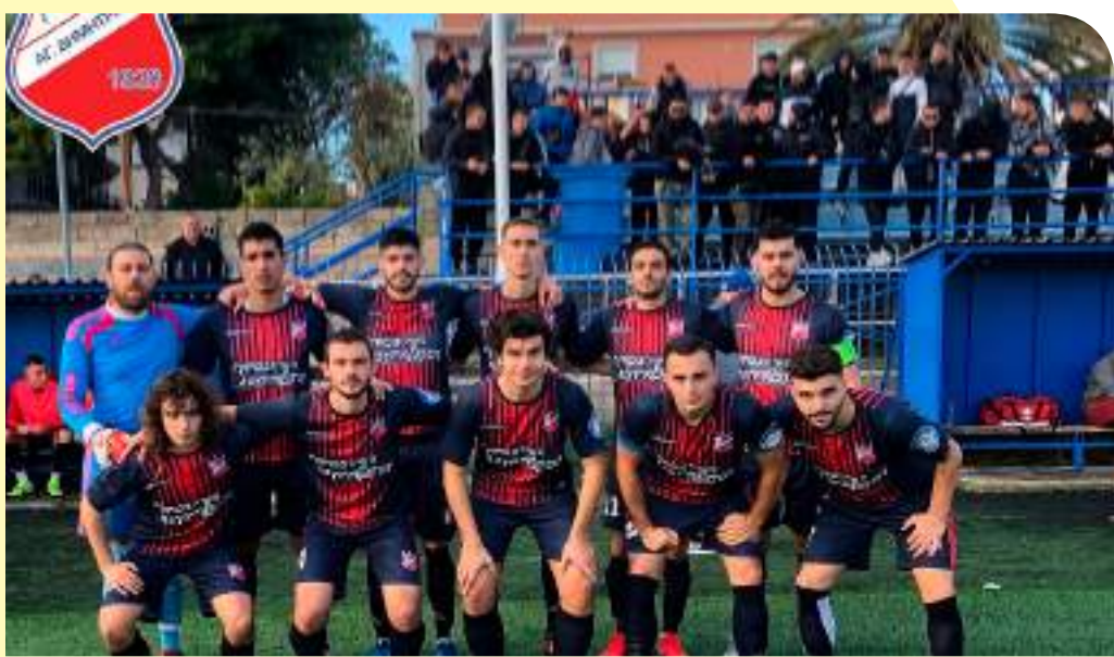
≠ Νίκησε ο Αγ. Δημήτριος και ελπίζει!