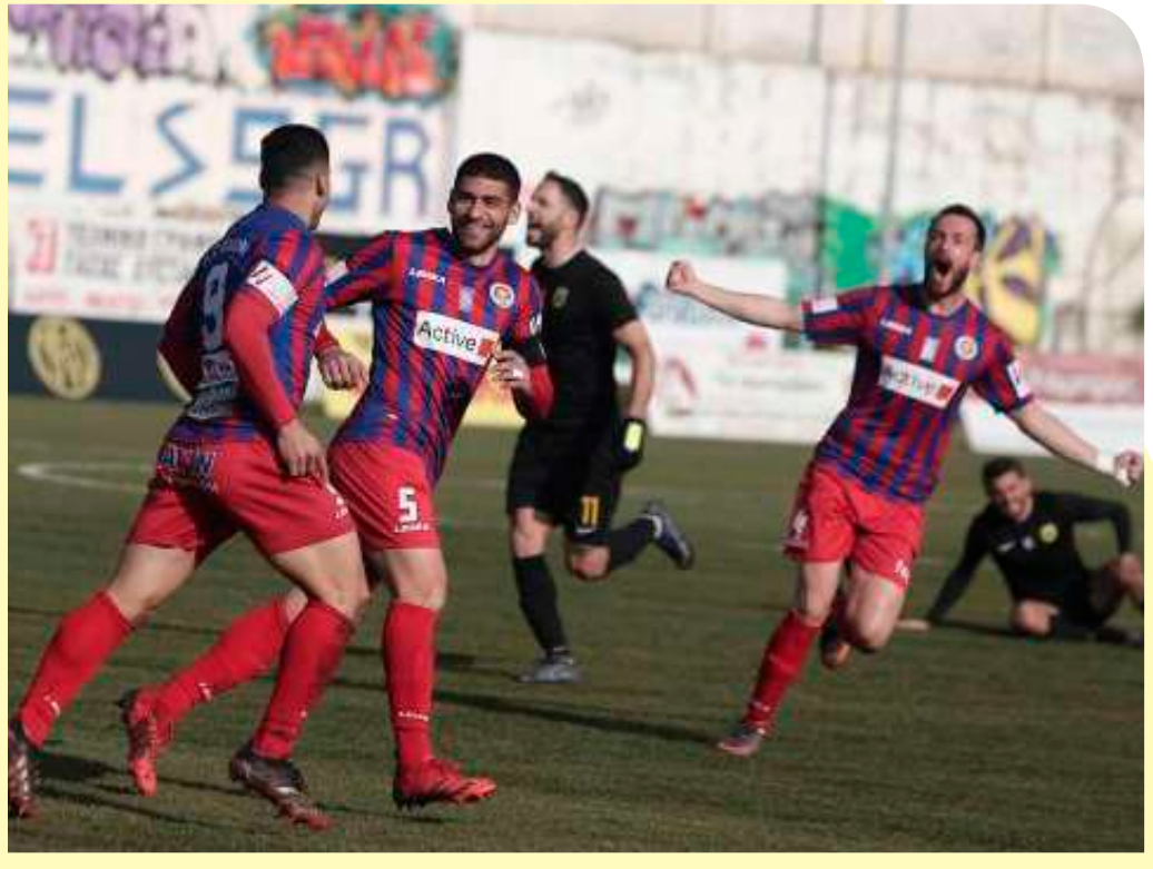
Από πρόσφατους πανηγυρισμούς των νικητών