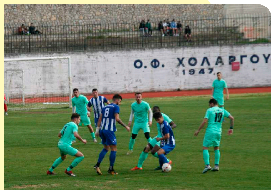
Στιγμιότυπο από το χθεσινό 0-0 του Χολαργού

Το μόνο που μπορεί κανείς να κρατήσει από τη χθεσινή αναμέτρηση του Χολαργού, ήταν κάποιες ελάχιστες ευκαιρίες που δημιουργήθηκαν μπρος στις δυο εστίες. Κατά τα άλλα είναι σίγουρο πως ο αγωνιστικός χώρος ήταν μια αιτία, ώστε να μην μπορέσουν οι παίκτες να βρουν ρυθμό και να παίξουν με κάτω την μπάλα, ενώ σε πολλές των περιπτώσεων η μπάλα σηκώθηκε από το χόρτο και οι δυο μονομάχοι προσπάθησαν να παίξουν με μακρινές – ψηλές μπαλιές, κάτι που όπως αποδείχθηκε δεν ευνόησε κανέναν! Ενώ δεν έλειψαν και τα σκληρά μαρκαρίσματα εκατέρωθεν. Σπου-