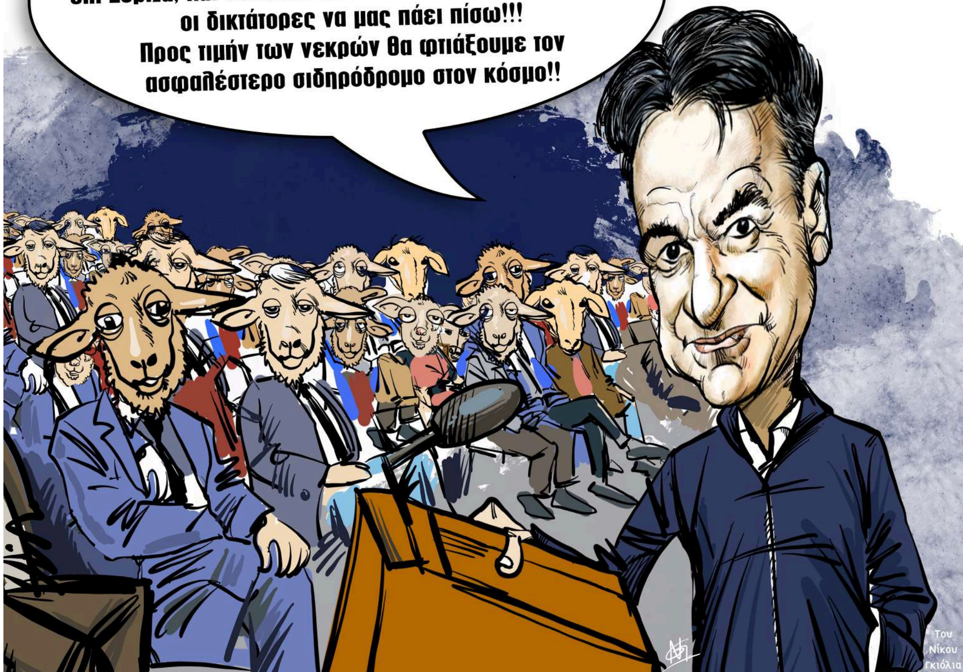
Του Νίκου Γκιόλια

Δεν θα αφήσουμε έναν Σταθμάρη, που πήγε δημοτικό επί χούντας, εκπαιδεύτηκε το 2022 από υπάλληλο που ανέλαβε καθήκοντα το 2015 επί Σύριζα, και δούλεψε πάνω στο δίκτυο που έφτιαξαν οι δικτάτορες να μας πάει πίσω!!! Προς τιμήν των νεκρών θα φτιάξουμε τον ασφαλέστερο σιδηρόδρομο στον κόσμο!!