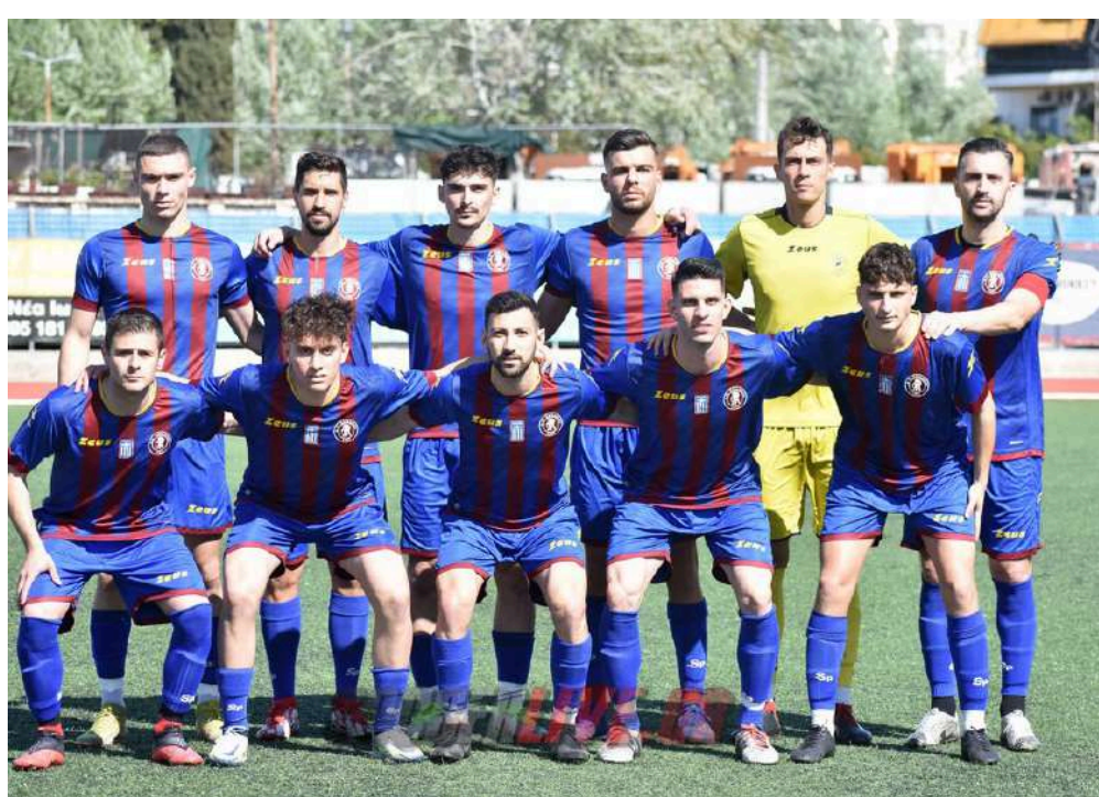
Ο ΑΟ Χαϊδαρίου

Σε ρυθμούς των επερχόμενων πλέι — οφ κινούνται εκ νέου στον Α.Ο. Χαϊδαρίου μετά το εορταστικό διάστημα των Αγίων ημερών του Πάσχα. Από το βράδυ της Δευτέρας το γή-