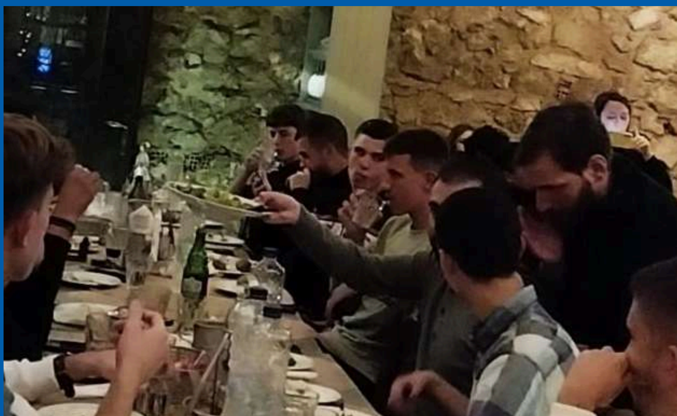
Στιγμιότυπο από το τραπέζι

Σε πλήρως επαγγελματικά πρότυπα κινούνται τα πάντα στον θρίαμβο Χαΐδαρίου όσον αφορά την εν γένει λειτουργία του φιλόδοξου σωματείου. Η διοίκηση των «κυανόλευκων» φροντίζει σε κάθε περίπτωση να επιλύει ό,τι είδους προβλήματα προκύπτουν πονιάροντας πολλά στο εκπληκτικό κλίμα που έχει καλλιεργηθεί και πολύ περισσότερο στις ανέσεις που πα-