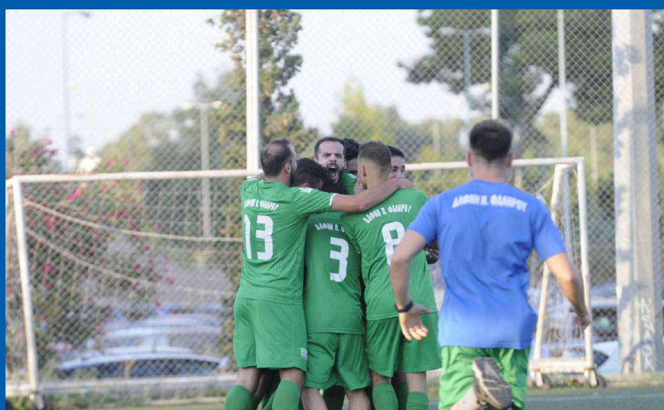
Από τους πανηγυρισμούς της νίκης

Την διαρκώς ανοδική της πορεία στον πρωτάθλημα του δευτέρου ομίλου της Α' Κατηγορίας ΕΠΣΑ πιστοποίησε η Δάφνη Παλαιού Φαλήρου με την ευρεία της νίκη με 5-1 επί του Αγίου Ιεροθέου. Σε μία αναμέτρηση όπου η ανάγκη κατάκτησης των τριών