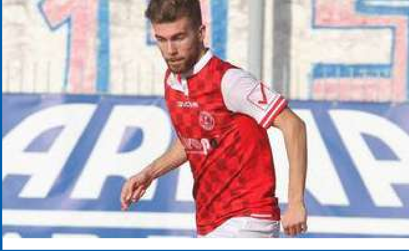
Ο Φραγκίσκος, Χίος

Έναν από τους καλύτερους και πλέον συνεπείς επιθετικούς των αθηναϊκών γηπέδων προσθέτει στο ... «οπλοστάσιό» της η θύελλα Αγίου Δημητρίου, στη προσπάθειά της να παρουσιαστεί ακόμη πιο ανταγωνιστική και το κυριότερο αποτελεσματική στην κρίσιμη συνέχεια που την περιμένει στο δύσκολο πρωτά-